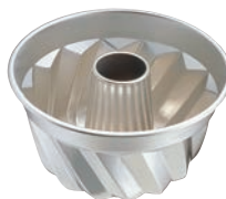
⑤ ギルタ クグロフ型