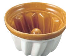
⑥ マトファー 陶器製 クーグロフ