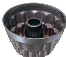
⑩ シリコン加工 二段菊