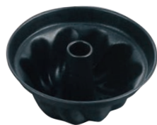
① マトファー エッグパン クーグロフ