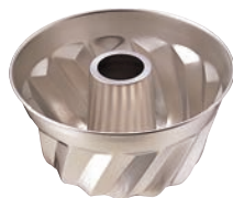
④ 18-8 クグロフ型 大