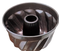
⑨ シリコン加工 ネジリ菊 大