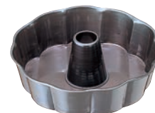
⑪ シリコン加工 ジャノメ