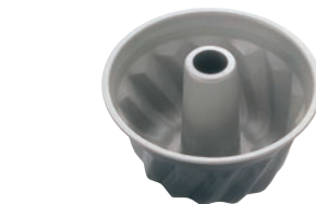
③ ブラックフィギュア クグロフ型