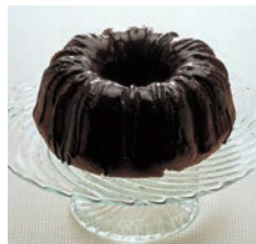
② トップブラックセラコン クグロフ型