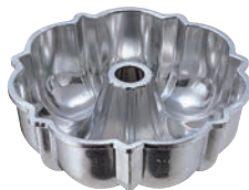
⑦ アルミダイカスト ブディング型