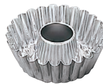
⑧ ステンレス 蛇の目型 No.535